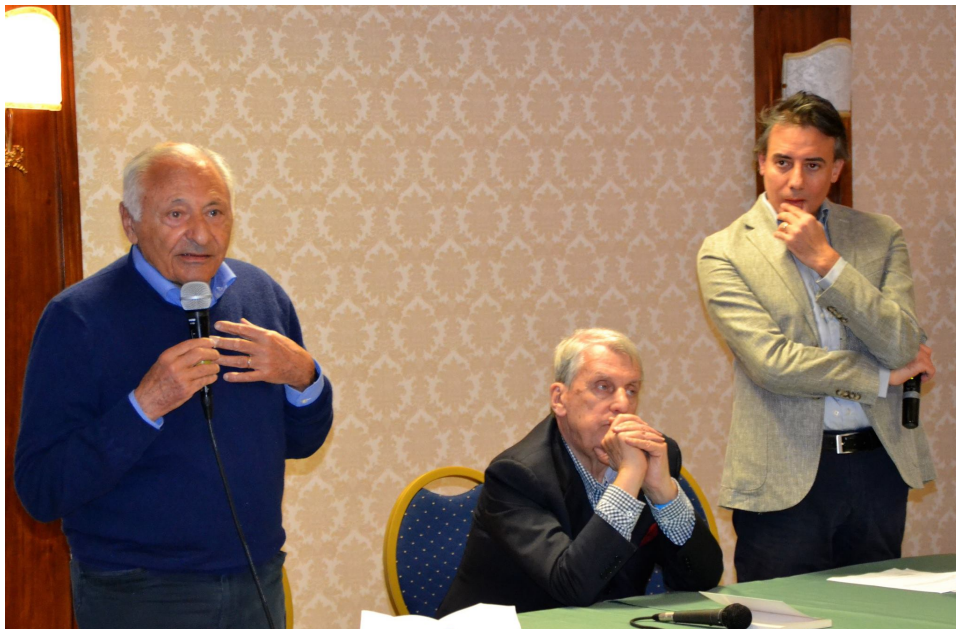
Premiazione 2° Premio Internazionale Salvatore Quasimodo presso La Tenuta dei Ciclamini Vai a vedere l'album completo