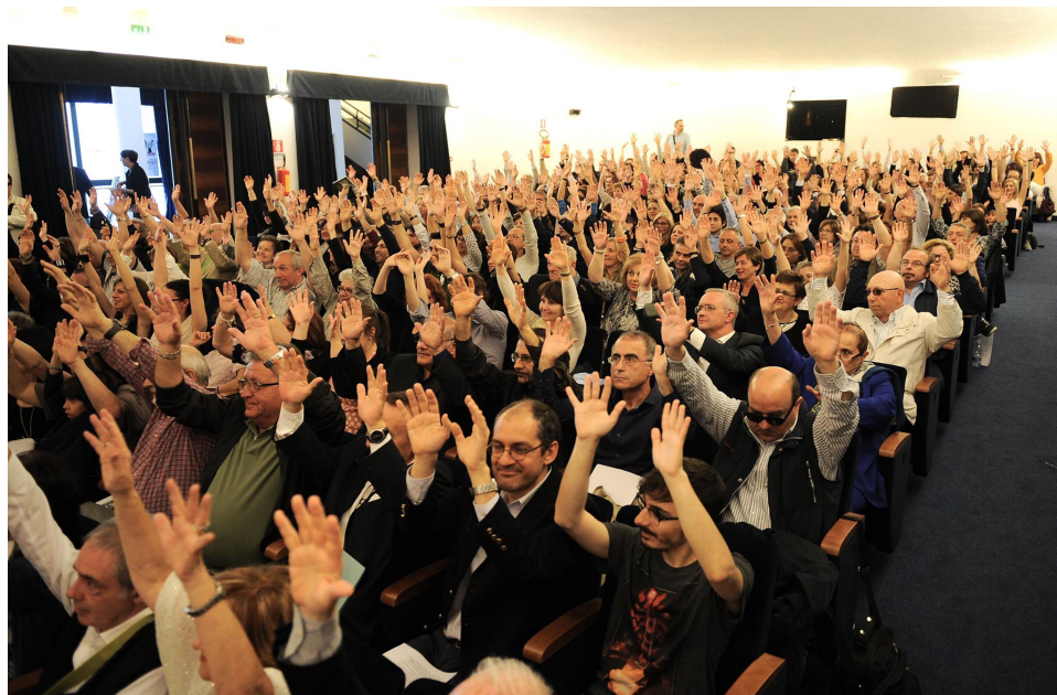
Premiazione 1° Premio Internazionale Salvatore Quasimodo presso Il teatro Imperiale di Guidonia Vai a vedere l'album completo