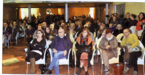
Il pubblico in sala.