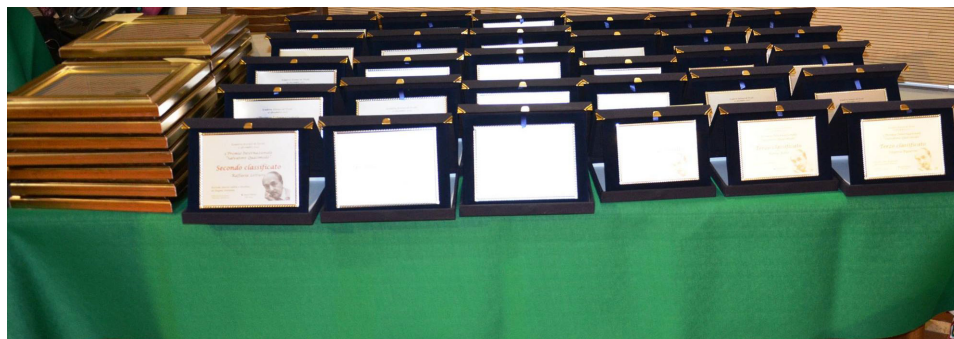
Premiazione 3° Premio Internazionale Salvatore Quasimodo presso Le Scuderie Estensi di Tivoli Vai a vedere l'album completo