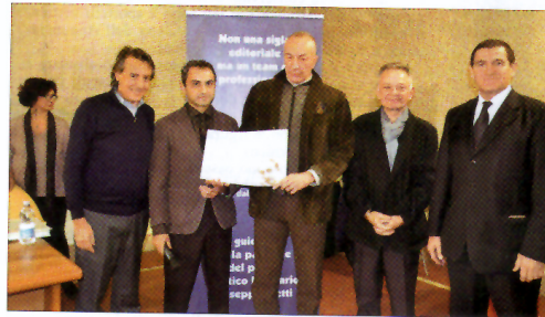
Al centro il poeta georgiano.

Anche la cerimonia di premiazione di questa terza edizione, targata Aletti Editore, si è conclusa con successo, annoverando numerose e importanti presenze.